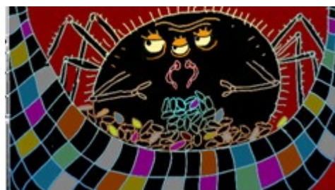
Chroniques animales / L'araignée (pilote de série)

La Vénus de Rabo de François Bertin, 2010, 10' (Sous réserve)